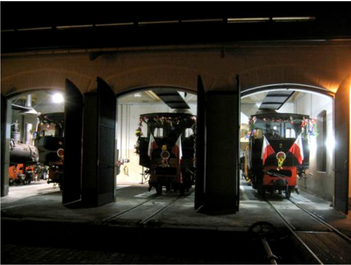
Saisonabschluss 2008, letzte Fahrt am 26.Oktober.