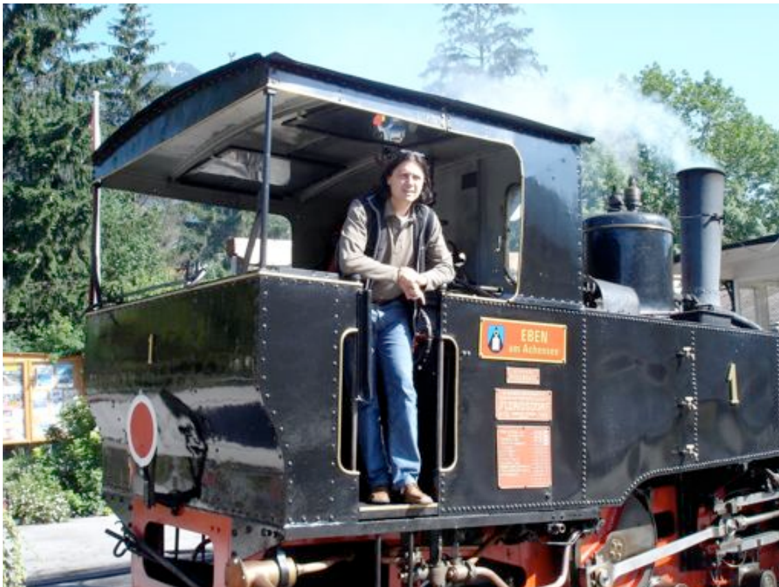
Lok 1, (EBEN) kurz vor dem Brandschaden vom 16. Mai 2008.