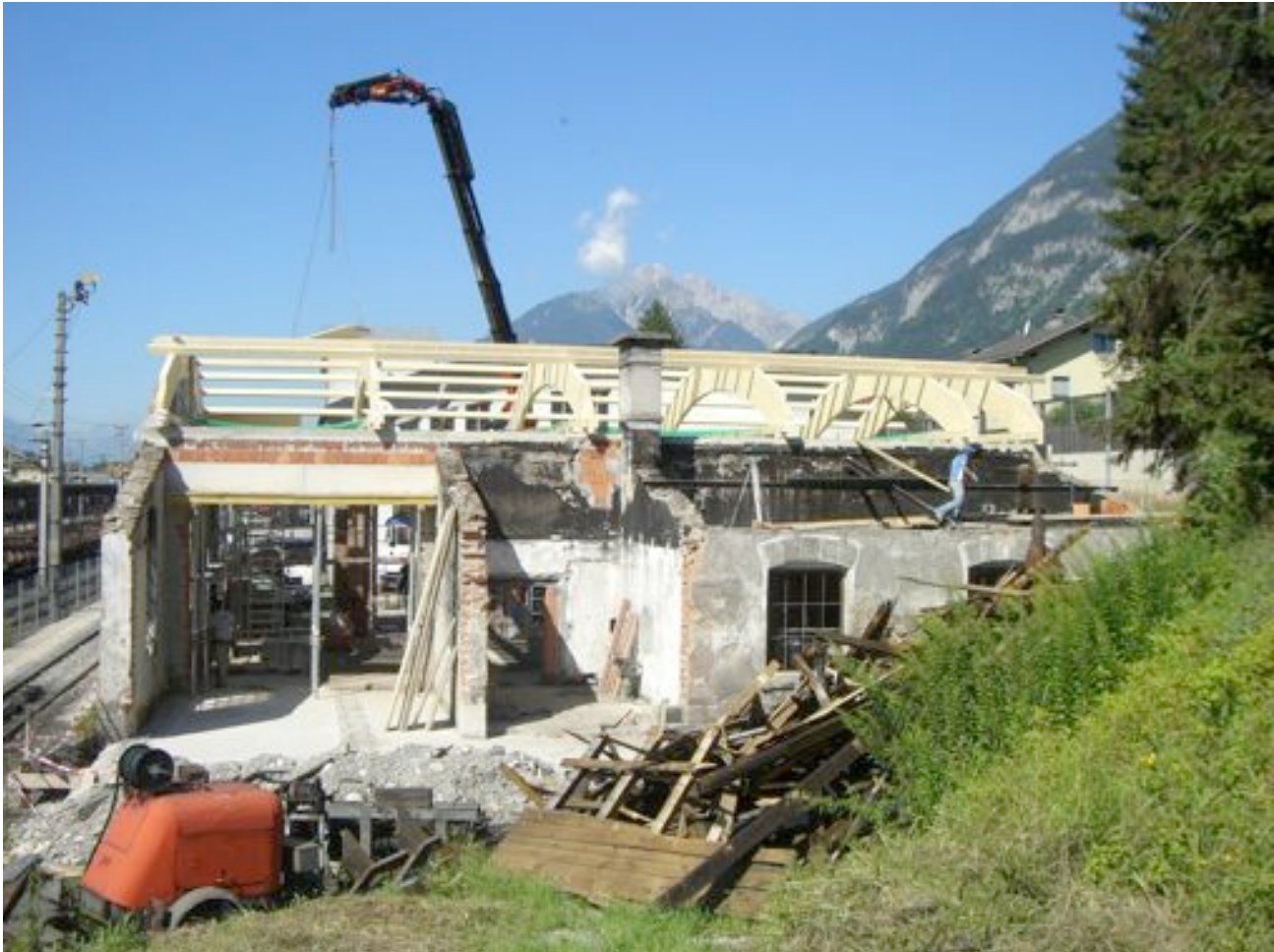
Aufbau des Heizhauses im Juni 2008: Fa.Haidacher den Dachstuhl, Fa.Rieder die Baumeisterarbeiten.