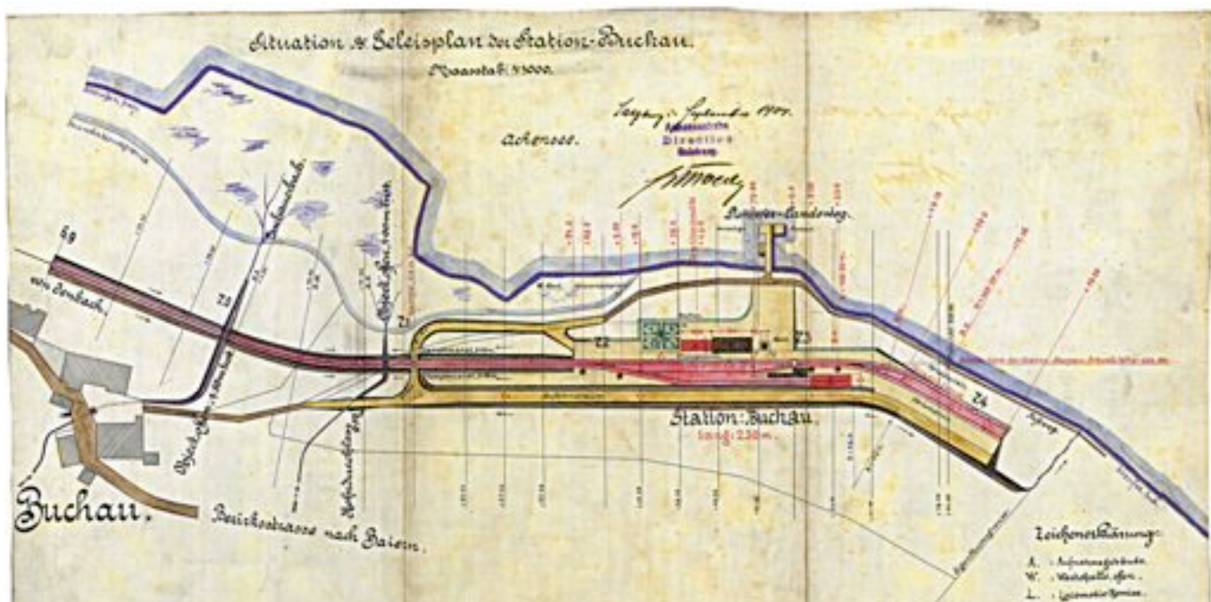
Entwurf einer Schiffs- und Bahnstation in der Buchau vom September 1904.