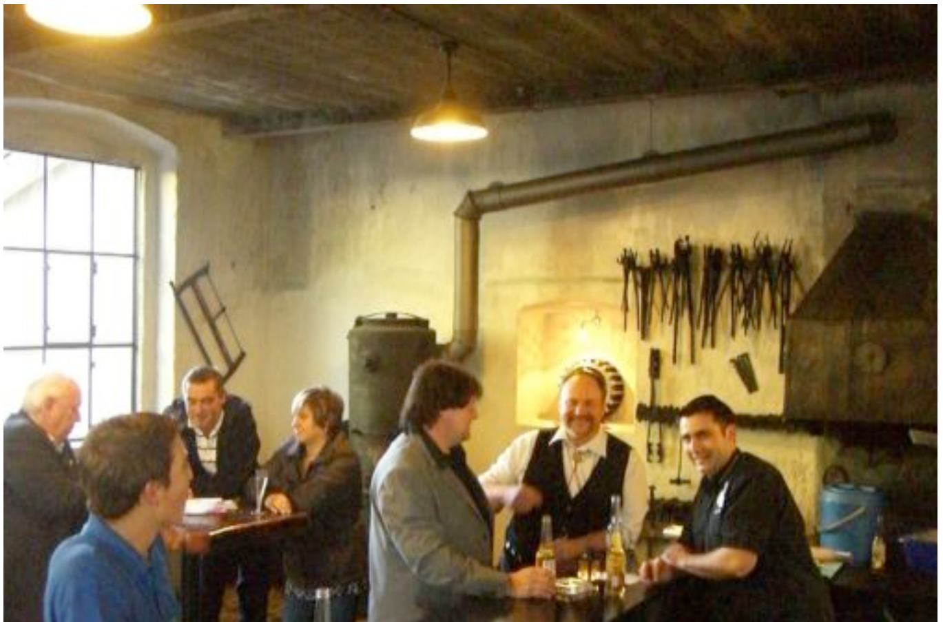
Partystimmung in der Erlebniswelt "Historische Werkstätte" der Achenseebahn

Saison-Abschlussfahrt mit geschmückten Zügen.