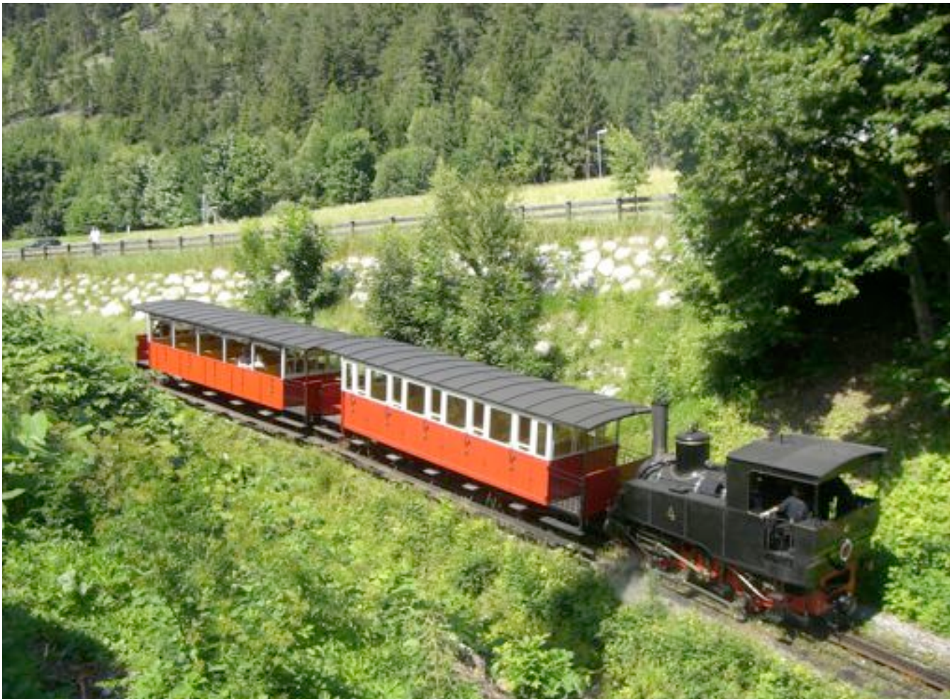
Lok 4, 1.Probefahrt am 12.06.2008

Zusammenbau der Lok 4 in der Werkhalle der Achenseebahn.