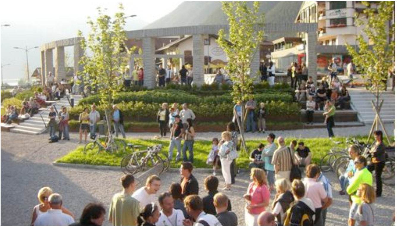
rock@lok Konzert am "Bahnhof Maurach Mitte"