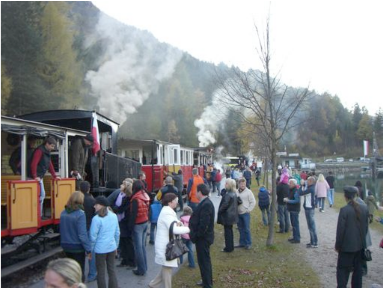
Großer Andrang zur Abschlussfahrt mit 1.022 Personen am 26.Oktober 2008.