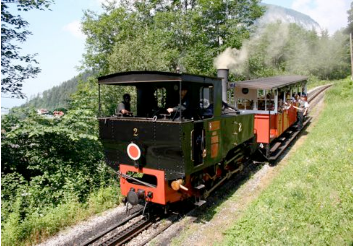
Lok 2 ober Burgeck, 160‰ Steigung.