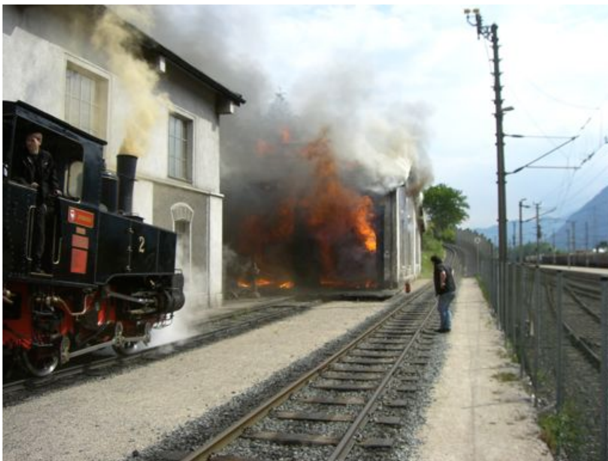
Brand des Heizhauses am 16.Mai 2008, Lok1, über 20 Minuten im Vollbrand.